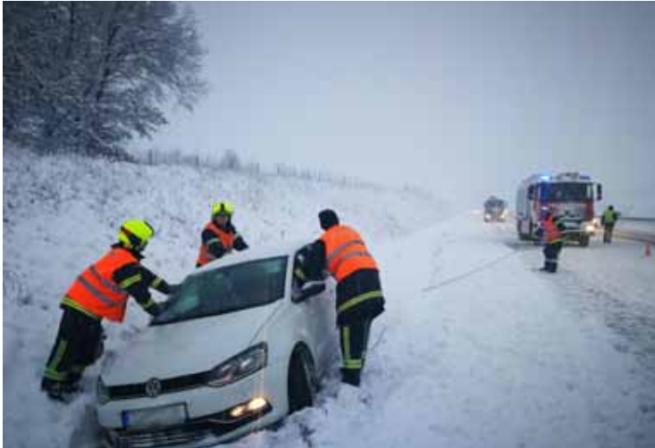
28. Jänner: eine von mehreren Pkw- und Lkw-Bergungen im dichten Schneetreiben