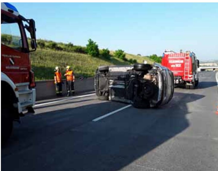
25. Juni: nach mehreren Auffahrunfällen waren insgesamt fünf Pkws zu bergen