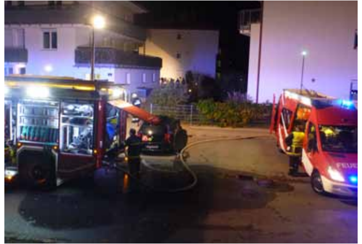
26. Oktober: Kellerbrand in der Wohnhausanlage in der Badgasse