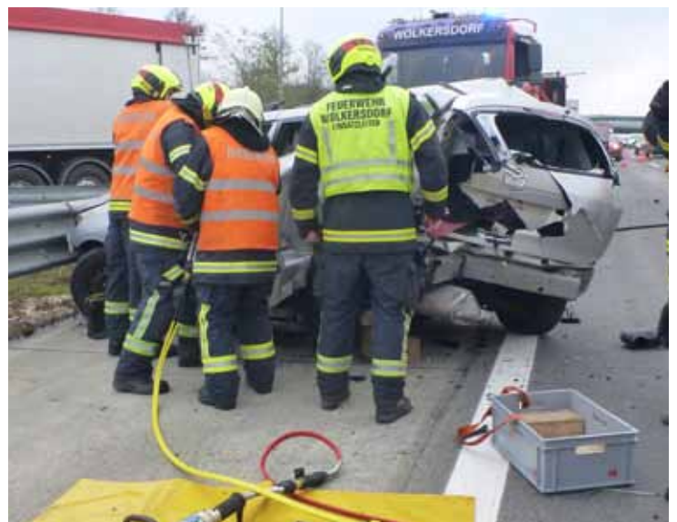
22. November: Menschenrettung auf der A5