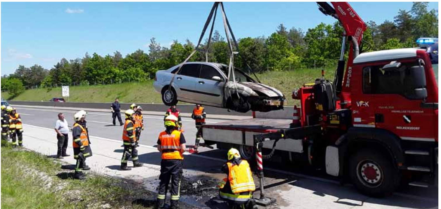
24. Mai: ein ausgebrannter Pkw war auf der A5 zu bergen – das kam 2019 mehrmals vor