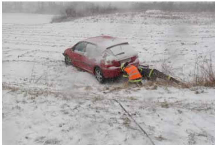
09.02.2015: Anfang Februar forderten uns mehrere Einsätze im starken Schneetreiben, darunter auch diese Pkw-Bergung auf der B7.