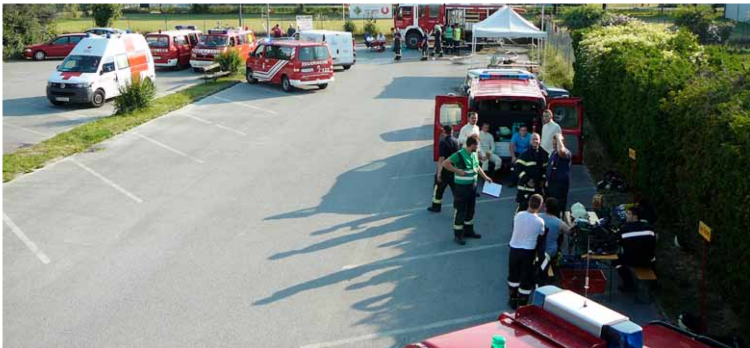
05.07.2015: Länger in Erinnerung bleibt uns der Einsatz am Wolkersdorfer Eislaufplatz, bei dem wir austretende Ammoniakdämpfe bekämpfen mussten. Nach mehreren Stunden Arbeit und nachdem die Schadstoffgruppe des Bezirks eingesetzt wurde, konnte die Gefahr gebannt werden.