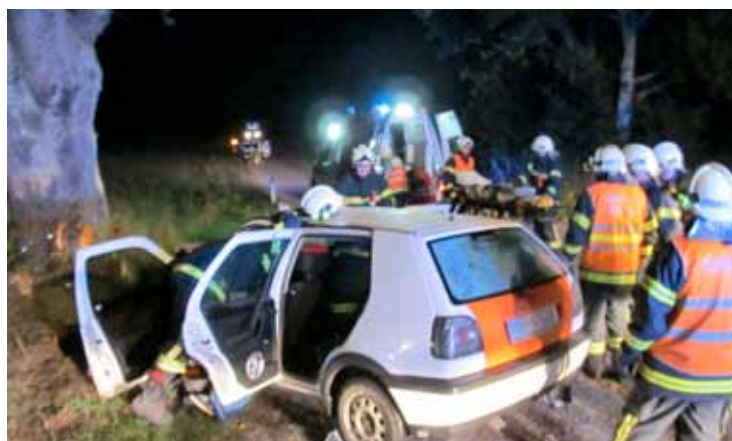
17.10.2015: Bei einer Menschenrettung zwischen Riedenthal und Wolkersdorf mussten wir den Fahrer mittels hydraulischen Rettungssatzes aus seinem schwer beschädigten Fahrzeug retten.