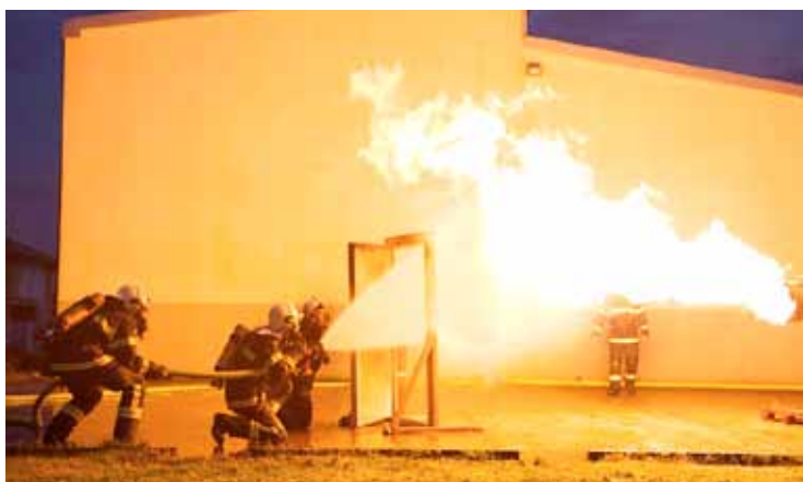
24.04.2015: Beim Flanschbrandtraining in Großengersdorf bekämpften wir eine austretende Gasflamme, was eine ideale Übung für den Umgang mit dem Hohlstrahlrohr ist.