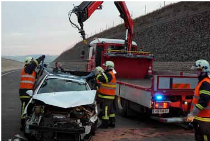
14.01.2015: Einer der ersten Einsätze des Jahres 2015 war die Bergung eines schwer beschädigten Pkws auf der A5, bei dem wir den Ladekran einsetzen mussten.