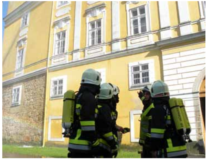
10. September – Großübung im Schloss Wolkersdorf: 170 Feuerwehrleute mit 32 Fahrzeugen von 16 Feuerwehren probten den Ernstfall und konnten ein sehr erfreuliches Resümee ziehen.