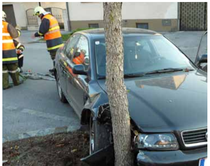
12. November – Pkw-Bergung in der Adlergasse: schwer beschädigt wurde der Pkw, als er aus ungeklärten Gründen von der Fahrbahn abkam und in einen Baum krachte.