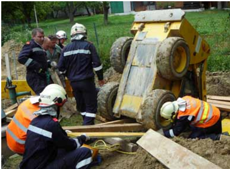
17. Juni – Menschenrettung aus einem Bagger in Münichthal: der Fahrer wurde eingeklemmt als der Bagger in die Baugrube stürzte, mittels Seilwinde und Hebekissen retteten wir ihn gemeinsam mit unseren Kameraden der FF Münichthal.