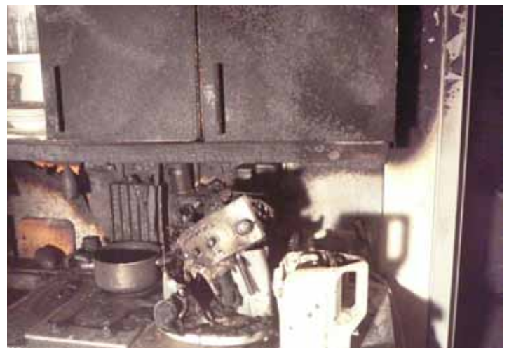
19. Dezember – Küchenbrand: unter schwerem Atemschutz löschten wir einen Küchenbrand mitten in Wolkersdorf und befreiten danach das Gebäude von den dichten Rauchschwaden.