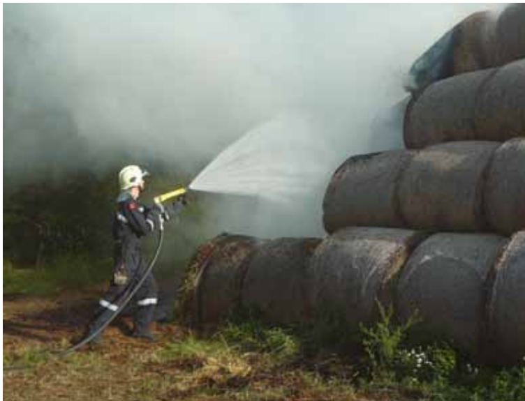
21. Juni – Brand mehrerer Strohballen beim Hochleithenwald: bis in die Abendstunden waren wir mit den Löscharbeiten und dem Aufstöbern der Glutnester beschäftigt.