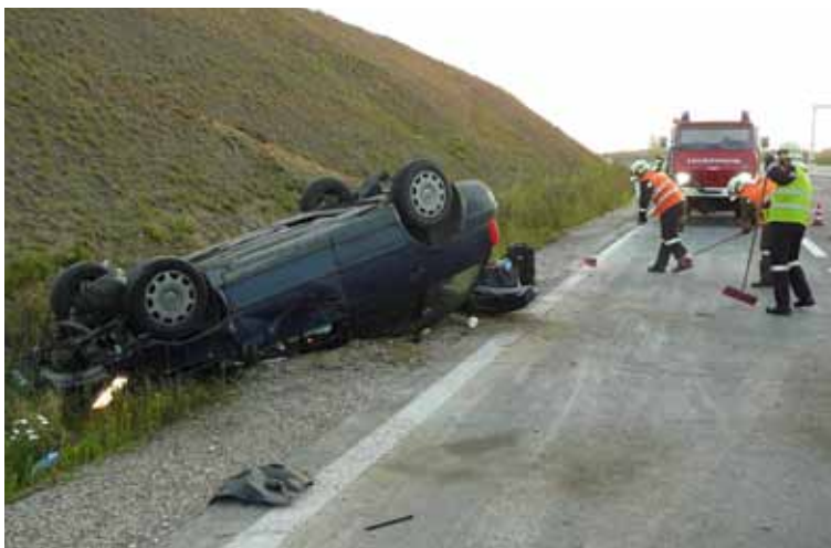
22. August – Pkw-Bergung auf der Autobahn: unverletzt blieben die Insassen dieses Pkws, der sich überschlug und im Straßengraben liegen blieb, den Entstehungsbrand konnten wir mittels Feuerlöscher im Keim ersticken.