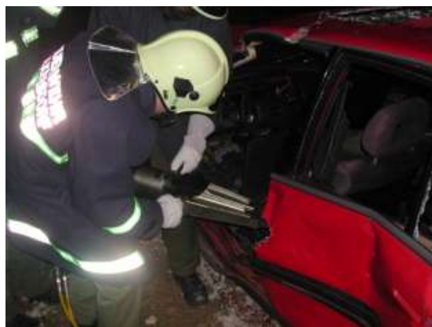
Es wird natürlich auch fleißig geübt: 03.03.2006: richtige Handhabung von hydraulischen Rettungsgeräten. Hier wurden bei einem Pkw die Türen und anschließend das Dach entfernt