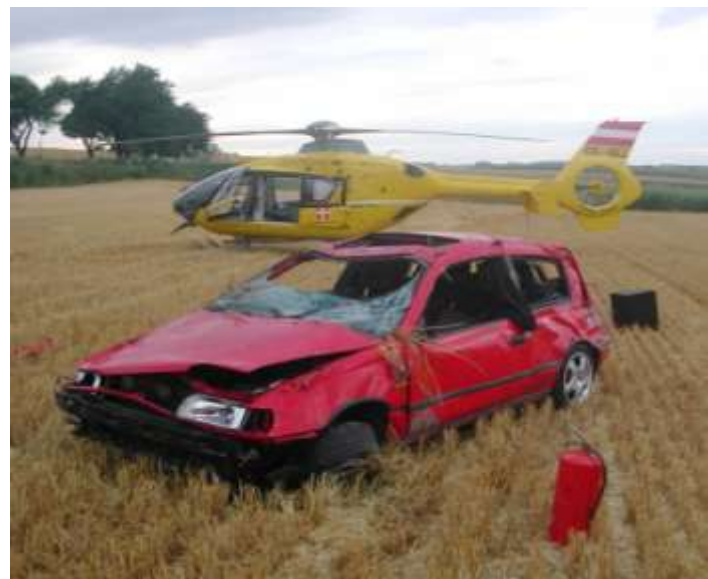
01.08.2006: Menschenrettung zwischen Münichsthal und Ulrichskirchen, die verletzte Person konnte sich selbst befreien und erlitt nur leichte Verletzungen