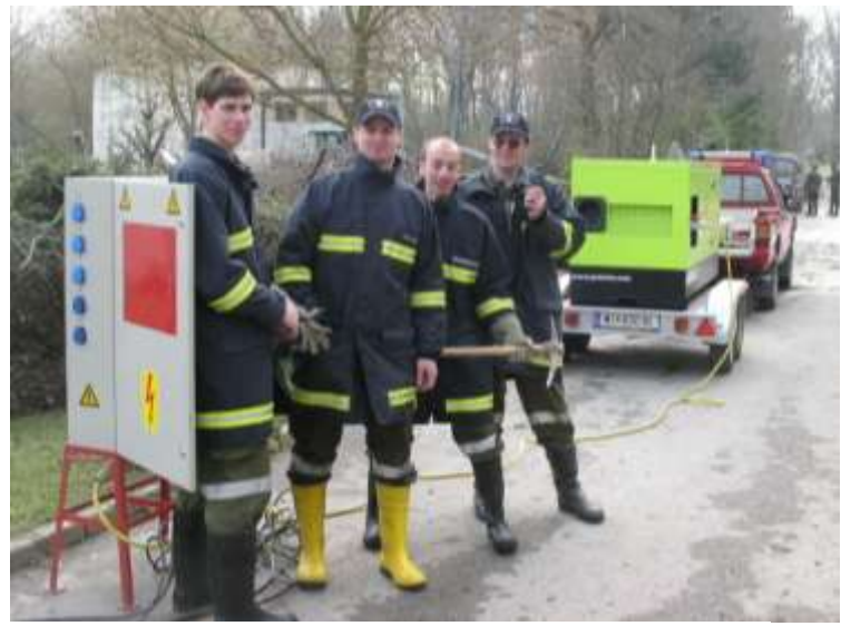
12.04.2006: KHD-Einsatz in Dürnkrot, insgesamt wurden wir fünf Mal im Katastrophengebiet eingesetzt, von Laa/Thaya bis Dürnkrot