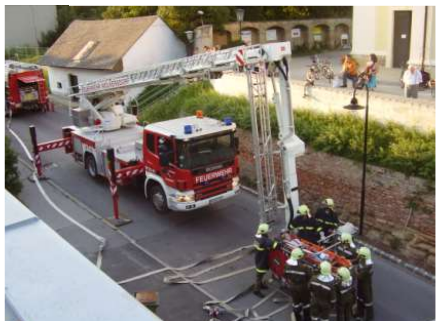
10.07.2006: Simulation eines Dachstuhlbrandes im Pfarrzentrum Wolkersdorf, Menschenrettung vom Dach, Löschangriff mit schwerem Atemschutz übers Stiegenhaus