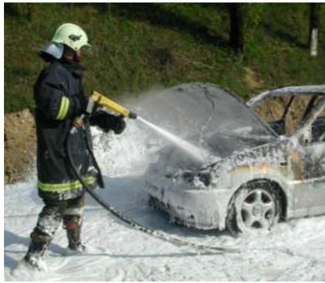
03.05.2006: Pkw-Vollbrand auf der B7, Ortseinfahrt Wolkersdorf